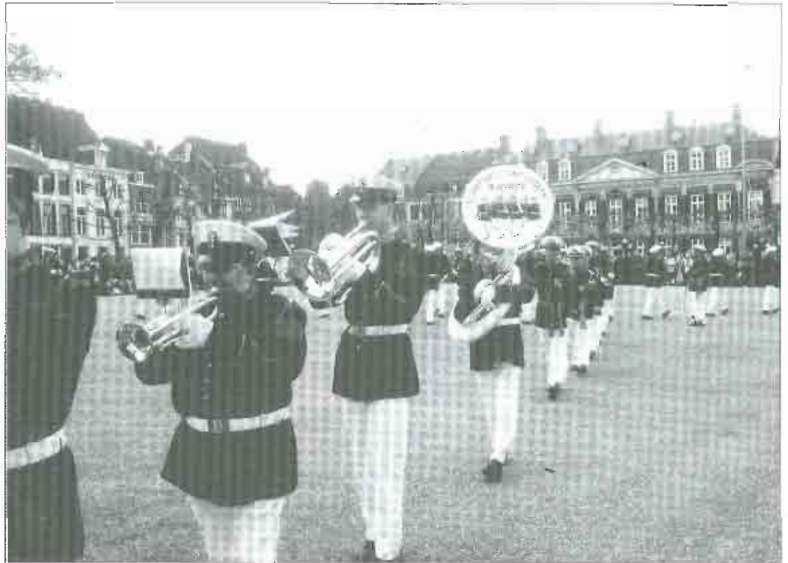
6 mei 2001 Maastricht - St. Joseph Buchten