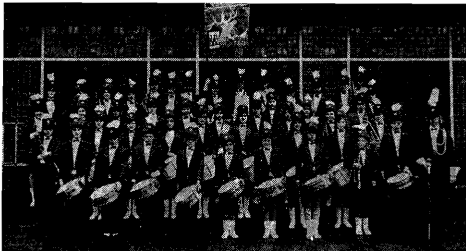
DE DRUMBAND IN HUIDIGE SAMENSTELLING.

Volgende maand belichten wij drumband "De Blerickse Herten" en als voorproefje hier al een voorproefje van het korps.